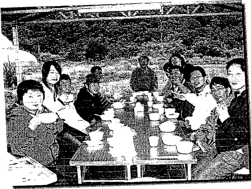
野外炊事場で調理を作り皆で夕食を摂りました 自然をバックに空気も美味しいです