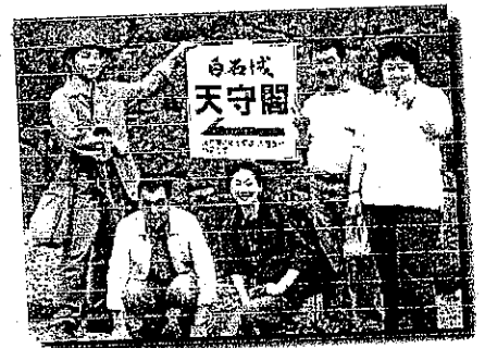
白石城にて、A班ハイポーズ