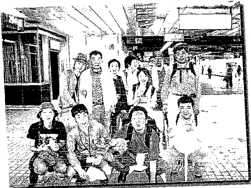
事故もなく皆で元気一杯帰ります