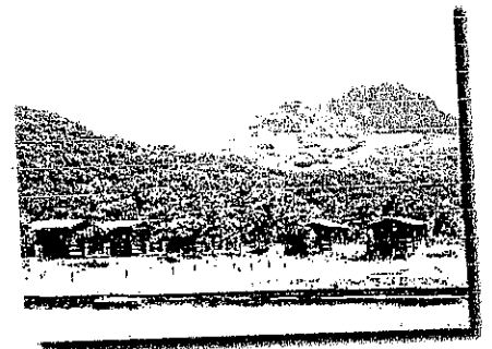
前は、このチピログハウスに泊りました