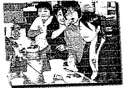
一階共同炊事場で朝食を作りました